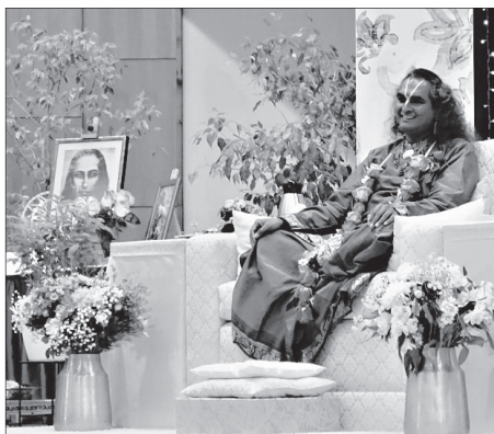
Svámí Višvánanda při daršanu v Praze 8. srpna 2022.

rozhodná je ale i kritika těchto nadpřirozených schopností ze strany jeho odpůrců: podle nich se jedná o kouzelnické triky, které nemají základ v ničem duchovním a spojení s náboženstvím jenom předstírají. Skutečně vážné obvinění se pak objevilo na začátku letošního roku: několik žen v Německu vydalo svědectví o sexuálním zneužití, jež se měl na nich dopustit svámí Višvánanda. 11 Nebyl ovšem předložen žádný tak průkazný důkaz, aby byl guru obviněn.