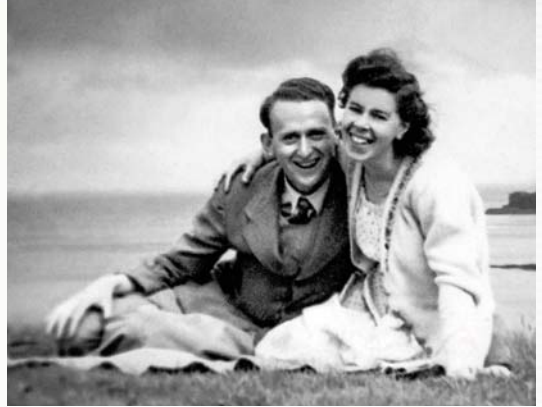
V Hemsworthu krátce po svatbě, 1949

„Jdeme do toho!“ Tak jsme reagovali já, můj manžel a můj bratr se svou manželkou na výzvu pustit se do jednoho úkolu. Proč jsme do toho chtěli jít a jak nás Jehova odměnil? Nejprve bych vám ráda povypovídala něco o své rodině.