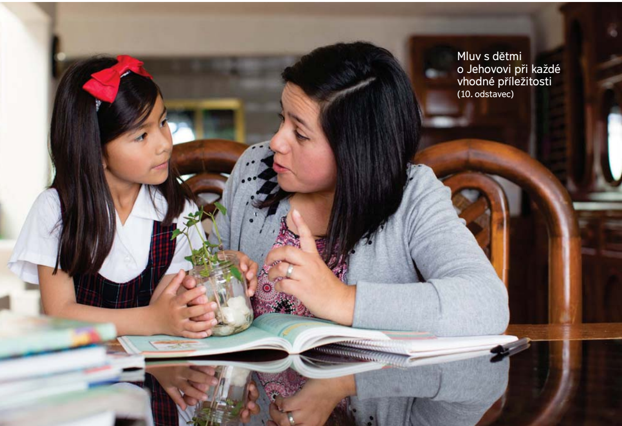
Mluv s dětmi o Jehovovi při každé vhodné příležitosti (10. odstavec)

10. Jak může rodič učit děti o Jehovovi v nábožensky rozdělené rodině?