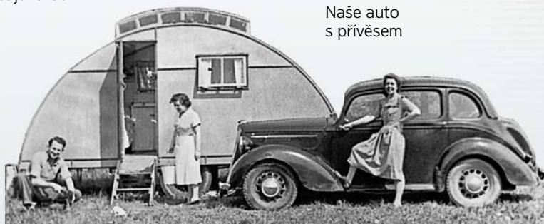
Naše auto s přívěsem

mi svědomí nedovolovalo podporovat válku, musela jsem během dalšího roku, to mi bylo 19, před soud ještě dvakrát. V obou případech soud celou věc vyřešil velmi rychle a v můj prospěch. Během celé té doby jsem cítila, že mě Jehova jakoby drží za ruku a posiluje mě svým svatým duchem. (Iz. 41:10, 13)