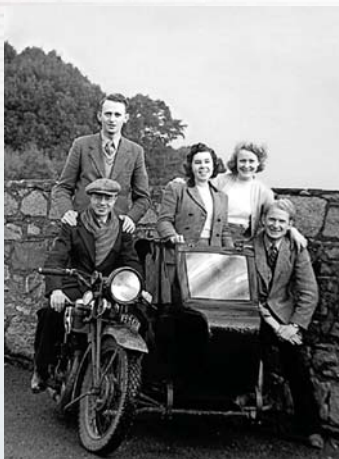
S průkopníky na motorce se sajdkárou