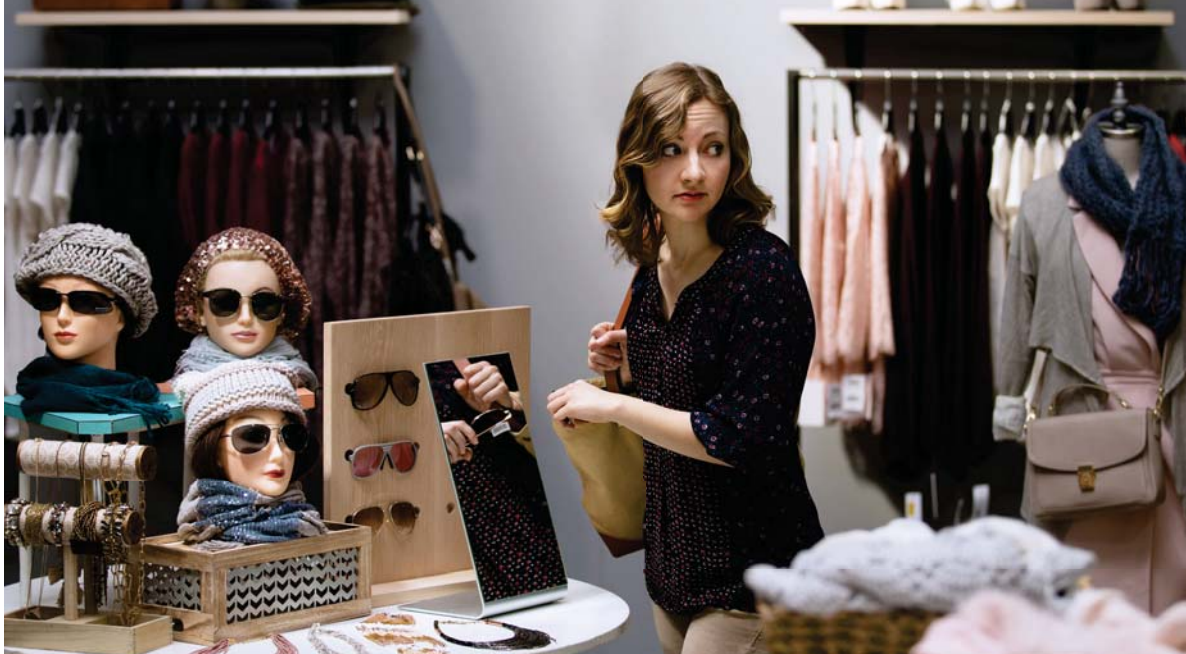
Jehova odsuzuje jakoukoli krádež (5. až 7. odstavec)